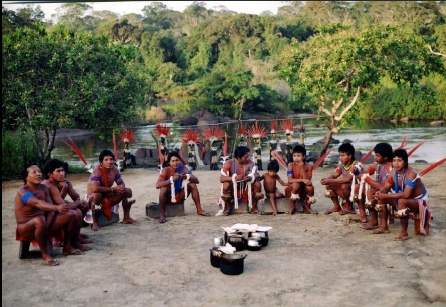
Années 1990, Parù © E.Camargo

Son importance ne réside pas tant dans sa forme que dans son sens