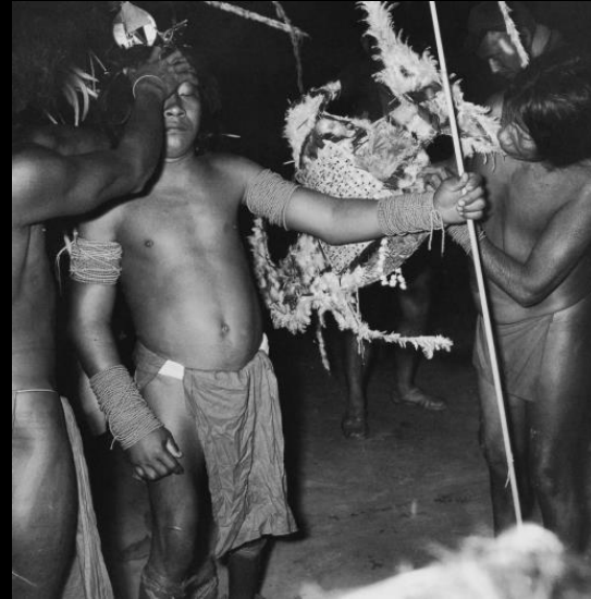
Années 1960