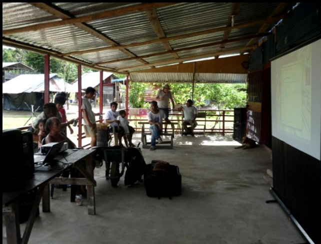
Mai 2011, rive surinamienne, en aval d'Anapaiké, magasin d'alimentation