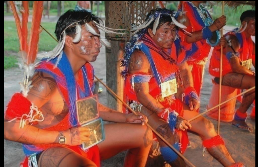
2004, Taluen