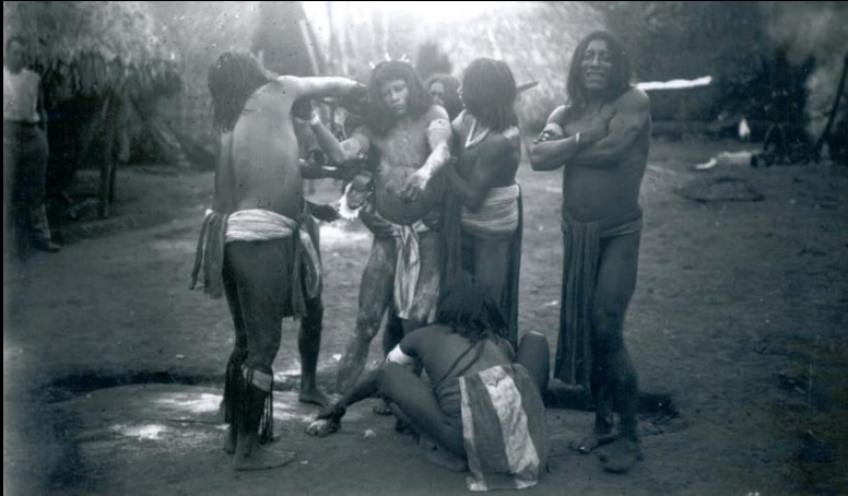
Expédition De Goeje, 1907