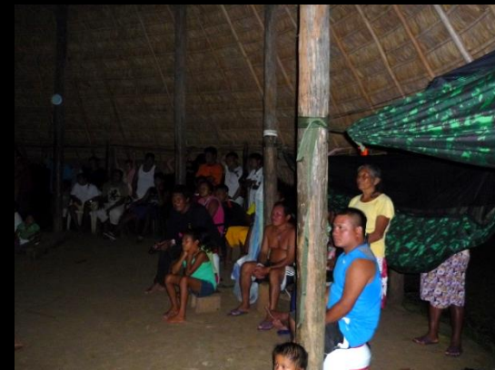
Mai 2011, Tukusipan d'Antecume Pata