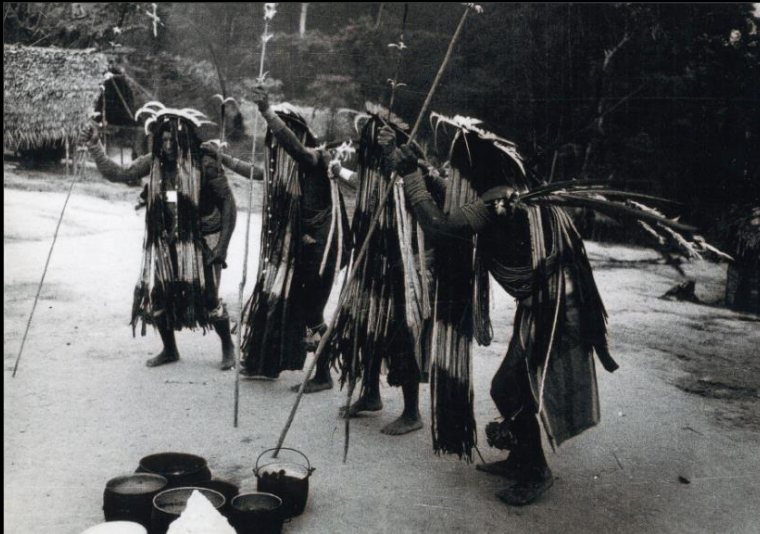
1967, Paru © Jauffrey