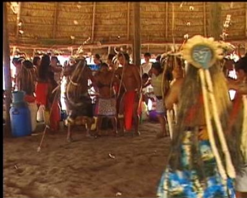
Le premier maraké se passait dès l'âge de 10-12 ans.