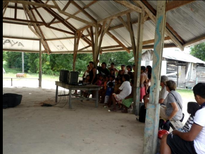
Mai 2011, Tukusipan de Cayodé,