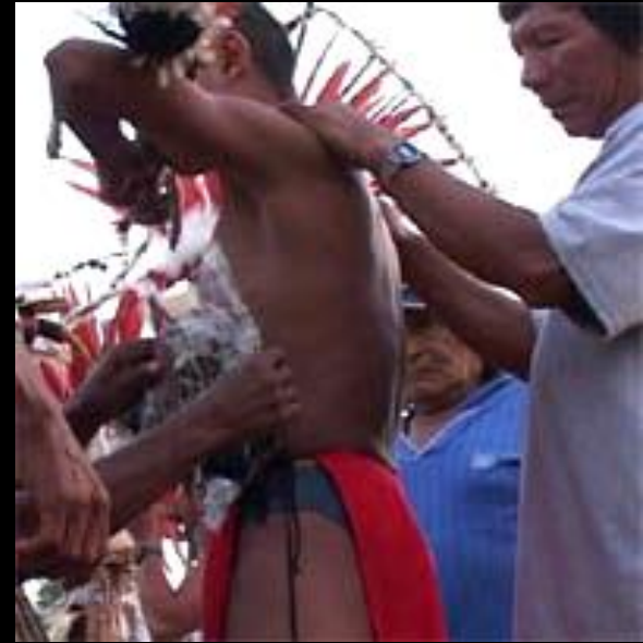
2004, Taluen