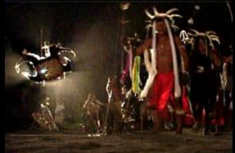
2004, Taluen